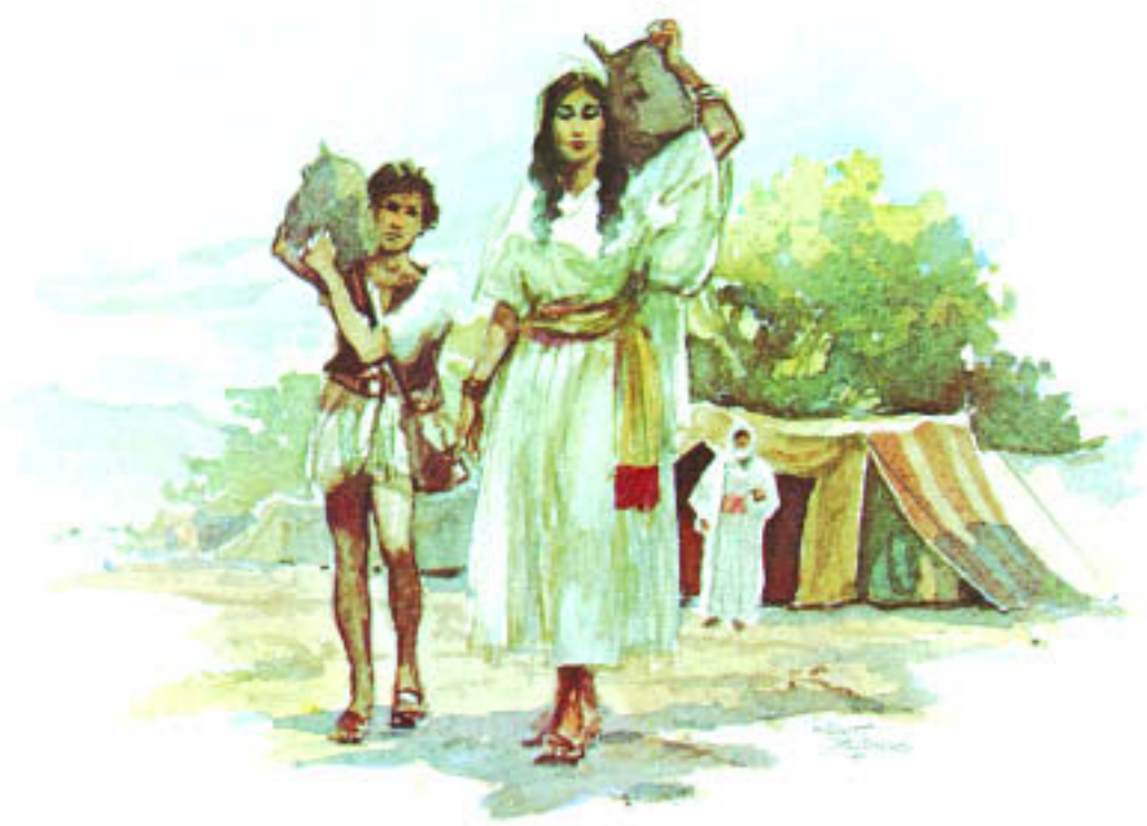
Hagar und Ismael werden fortgeschickt