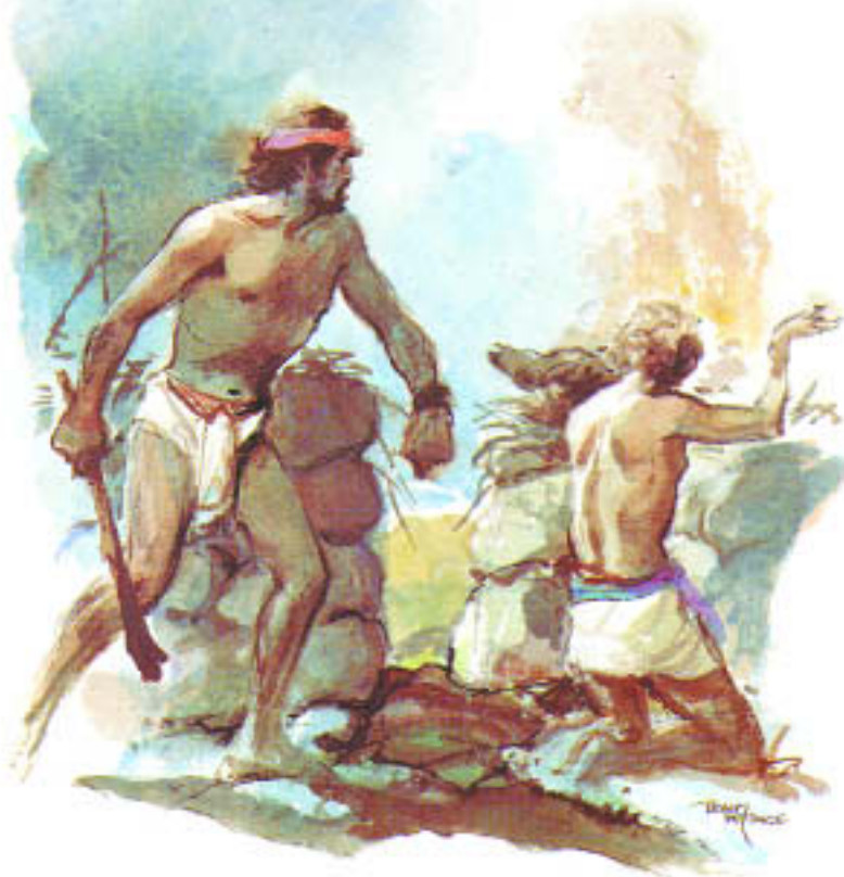
Kain und Abel

Lamech war wild und grausam. Dieser Raufbold hielt sich selbst für groß und gewaltig. Er sang seinen Frauen ein Lied über seine Heldentaten vor: