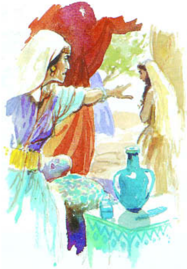
Sarai und Hagar

Engel des Herrn von Ismael. »Seine Hand wird gegen alle und die Hand aller gegen ihn sein. Und er wird all seinen Brüdern zum Trotz wohnen.«