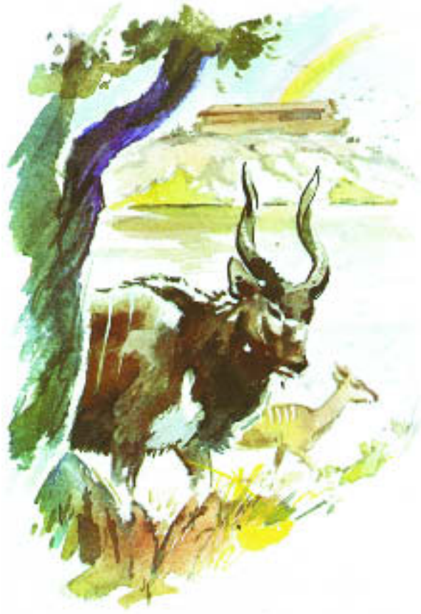
Nach der Sintflut

Nach der Sintflut lebte Noah noch 350 Jahre. Er starb mit 950 Jahren.