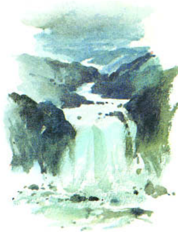
Die Erde war wüst und leer