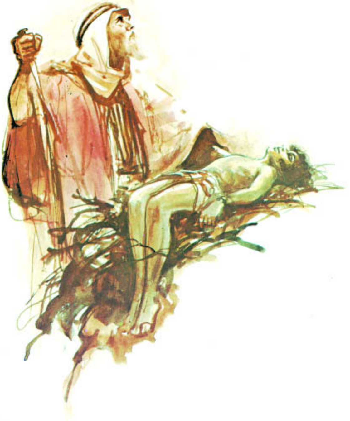
Abraham opfert Isaak