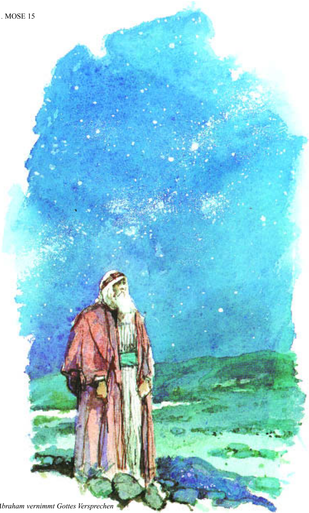
Abraham vernimmt Gottes Versprechen