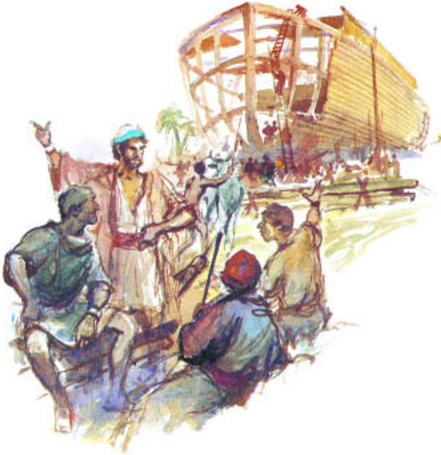
Der Bau der Arche

Seths ebenso zu verhalten wie die Nachkommen Kains: Sie vergaßen den Herrn und taten allerlei Böses. Sie dachten nicht einmal daran, dass Gott alle ihre Sünden sah.