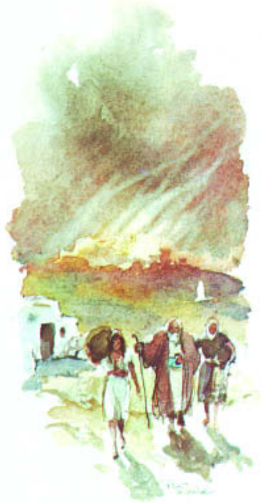
Die Zerstörung Sodoms

Darum fragte er den Herrn, ob er nicht in eine kleine Ortschaft in der Nähe fliehen könne. Der Herr war einverstanden und versprach, diese kleine Stadt nicht zu zerstören wie die anderen Städte. Später wurde sie »Zoar« genannt, was »die Kleine« bedeutet. Nun mußte sich Lot sehr beeilen; denn der Herr wollte nichts tun, bevor Lot in Sicherheit war. Lots Frau blieb unterwegs stehen und schaute zurück. Da erstarrte sie zur Salzsäule. Lot und seine Töchter liefen weiter. Als die Sonne gerade aufging, kamen sie in Zoar an. Da ließ der Herr Schwefel und Feuer vom Himmel herabregnen über Sodom und Gomorrha. Diese Städte