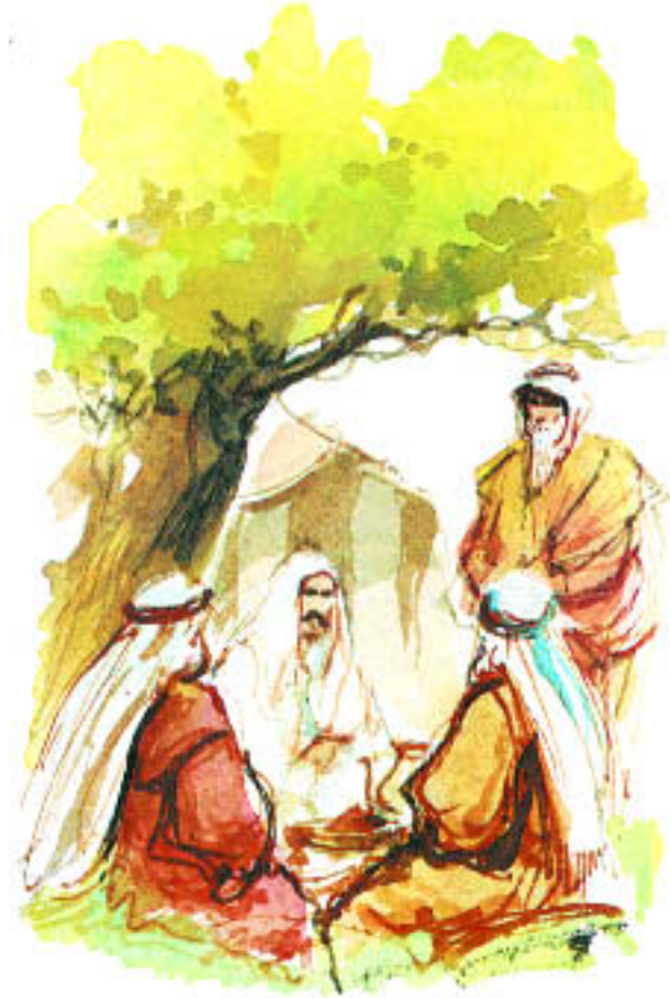
Abraham und die drei Männer

Danach standen die drei Männer auf und gingen in der Richtung nach Sodom davon. Abraham begleitete sie.