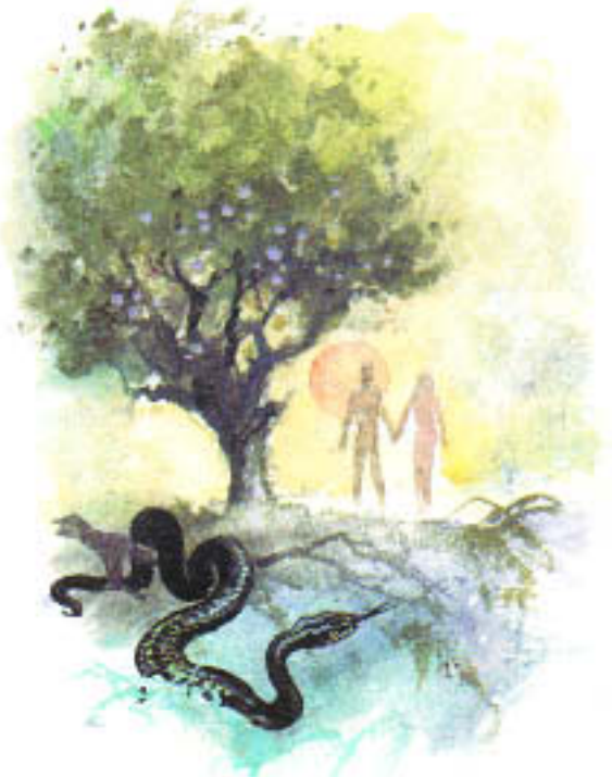
Der Baum der Erkenntnis des Guten und Bösen

»Aber nein! Nur von den Früchten des Baumes mitten im Garten dürfen wir nicht essen. Wir sollen sie auch nicht anrühren, hat Gott gesagt, sonst müssen wir sterben.«