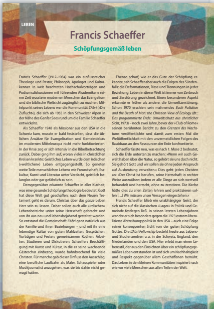
LEBEN Francis Schaeffer Schöpfungsgemäß leben Francis Schaeffer (1912-1984) war ein einflussreicher Theologe und Pastor, Philosoph, Apologat und Kulturkennner. In weit beachteten Hochschulvorträgen und Podiumsdiskussionen mit führenden Akademikern seiner Zeit wusste er modernen Menschen das Evangelium und die biblische Weltanschauung zugänglich zu machen. Mittelpunkt seines Lebens war die Kommunität Cedar (Die Zuffache), die sich ab 1955 in den Schweizer Alpen in der Nähe des Genfer Sees rund um die Familie Schaeffer entwickelte. Als Schaeffer 1948 als Missionar aus den USA in die Schweiz kam, musste er bald feststellen, dass die üblichen Ansätze für Evangelisation und Gemeindebau in moderner Mitteleuropa nicht mehr funktionsfähig waren. In der Kirche zog er sich immer in die Bibelforschung zurück. Dabei ging ihm auf, was er vieles in christlichen Kreisen kannte: Geistliches Leben wurde dem irdischen (weltlichen) Leben entgegengesetzt. So gieneten weite Teile menschlichen Lebens wie Freundschaft, Esskultur, Kunst und Literatur unter Verdacht, geistlich belanglos oder gar gefährlich zu sein. Demgegenüber erkannte Schaeffer in aller Klarheit, was eine gesunde Schöpfungstheologie bedeutet: Gott hat diese Welt gut geschaffen, nach dem Neuen Testament geht es darum, Christus über das ganze Leben Herr sein zu lassen. Dabei sollen auch alle irdischen Lebensbereiche unter seine Herrschaft gebracht und von ihr aus neu und lebensbejahend gestaltet werden. So entstand die Gemeinschaft Cedar ganz natürlich aus der Familie und ihren Beziehungen - und mit ihr eine lebendige Kultur von gutem Malzbraten, Gesprächen, Vorträgen und Festen, gemeinsamen Kirchen, Arbeiten, Studieren und Diskutieren. Schaeffers Beschäftigung mit Kunst und Kultur, in die er seine wachsende gläubige Anhängerschaft einbezog, wurde für viele Christen für manche der besten Einflüsse den Ausschlag, eine berufliche Laufbahn als Maler, Schauspieler oder Musikjournalist anzugehen, was sie bis dahin nicht gewagt hatten.

Viele Orte aus biblischer Zeit sind dem heutigen Leser unbekannt. Doch wenn wir uns die Geografie der Bibel anschauen, entdecken wir, dass die damalige Welt gar nicht so viel anders war als unsere heutige Welt. Die Ortsbeschreibungen stellen den betreffenden Ort auf der Landkarte dar und bieten Informationen über ihn und über das Leben der Menschen, die dort wohnten.