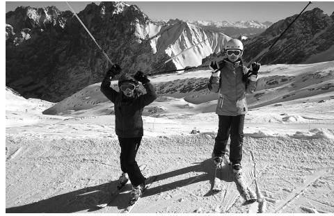
Skihasen auf der Piste

da ganz seiner Meinung und ich glaube, wir haben viel in eine gute, stabile Beziehung zu unseren Töchtern investiert. Aber es wäre zu einfach zu sagen, dass sich das jetzt auszahlt. Wir erleben in unserem Umfeld auch Familien, die durch Krankheiten oder andere Umstände an ihre Grenzen kommen. Und mir ist bewusst, es ist Gnade, dass wir uns als Familie haben, dass wir gesund sind, zusammenhalten und aufeinander zählen können.