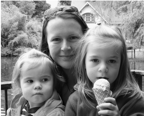
Eis essen im Leipziger Zoo