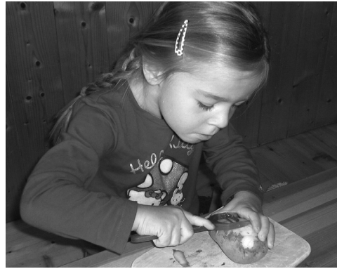
Hoch konzentriert im Kindergarten