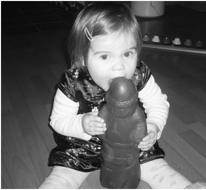
Von der Herausforderung, einen Weihnachtsmann zu verspeisen