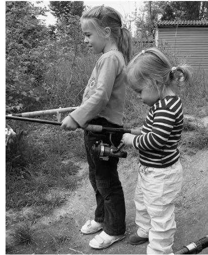
Zwei kleine Anglerinnen

die ich sehr gerne annehmen würde, weil sie mir Befriedigung verschafft und uns dabei hilft, die Raten für das Haus abzubezahlen? Oder haben die Bedürfnisse unseres Kindes Vorrang? Was ist jetzt richtig? Und was kann ich tun, um das herauszufinden?