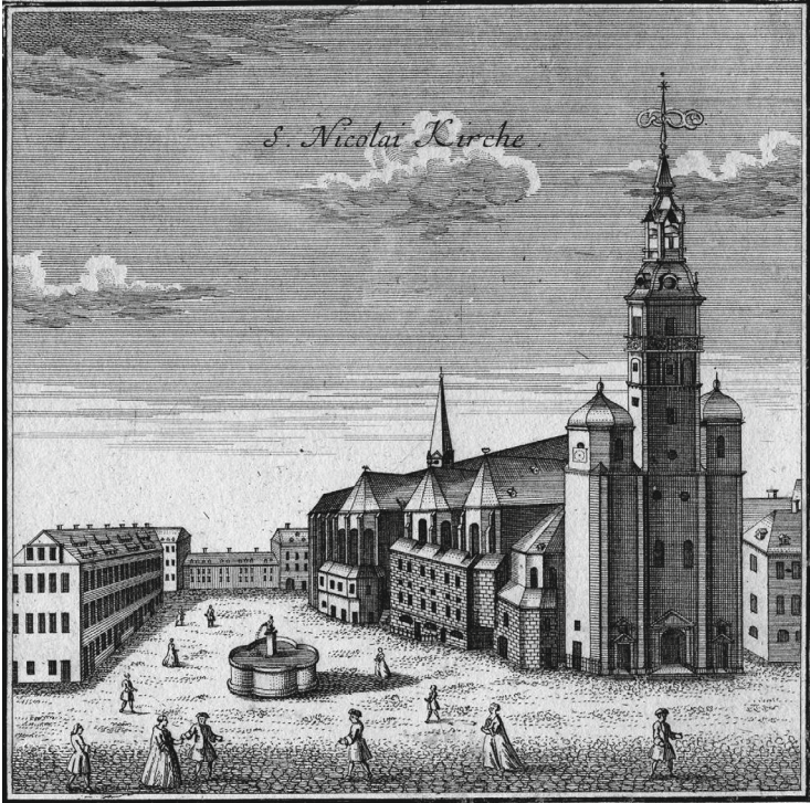
Nikolaikirche Leipzig. Kupferstich

für ein sechsteiliges Weihnachtsoratorium, das an sechs aufeinanderfolgenden Fest- und Sonntagen aufzuführen ist, von dieser Tradition der Passionsaufführung in Mitteldeutschland herrührt. 4 Am Karfreitag 1734, im selben Jahr, in dem das Weihnachtsoratorium entsteht, führt Bach in Leipzig die Passionsmusik Ein Lämmlein geht und trägt die Schuld von Gottfried Heinrich Stölzel auf. Wie es scheint, hat er das Werk an einem Tag aufgeführt (von dieser Aufführung hat sich nur das Libretto erhalten), doch existiert Aufführungsmaterial aus Sondershausen und Gotha, auf dessen Partitur eine Aufführung über zwei Tage – Gründonnerstag und Karfreitag – vermerkt ist. Hinzu kommt noch, dass Stölzels Werk keine dramatische, sondern eine betrachtende – nach innen gewendete – Passion ist. Dieser Wesenszug trifft auch auf das Weihnachtsoratorium zu, das sich eindeutig die Stölzel'sche Passion zum Mus-