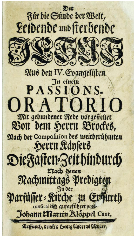
Reinhard Keiser: Titelblatt zur Brockes-Passion, aus dem die mehrtägige Aufführung »nach denen Nachmittags-Predigten« hervorgeht.

Einheitsstiftende Momente in Bachs Musik verbinden die sechs Teile eng miteinander. Mit einer musikalischen Konkordanz zwischen dem allerersten und dem letzten Choral setzt Bach einen Rahmen, der das gesamte Werk vom ersten bis zum sechsten Teil umspannt. Für »Wie soll ich dich empfangen?« und »Nun seid ihr wohl