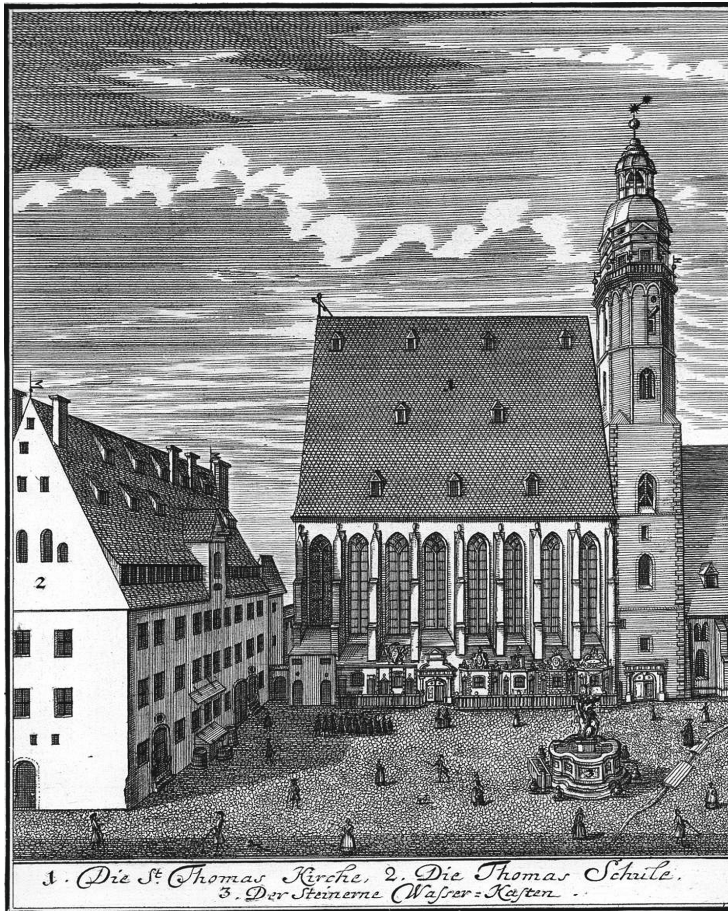
Thomaskirche Leipzig und Schulgebäude. Frontispiz der Thomasschulordnung 1723

trennt aufzuführenden Teilen, die Bach gekannt haben kann. In seiner Heimat Thüringen war es seit dem 17. Jahrhundert üblich, Passionsaufführungen auf mehrere Tage zu verteilen, eine Tradition, die noch bis ins frühe 18. Jahrhundert reicht.